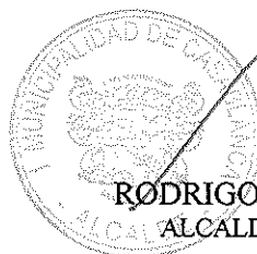
RODRIGO MARTINEZ ROCA ALCALDE DE CASABLANCA